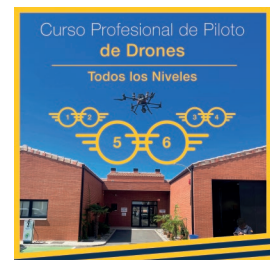
Todos los niveles

Encuentra packs, financiación y más opciones en droneprix.es